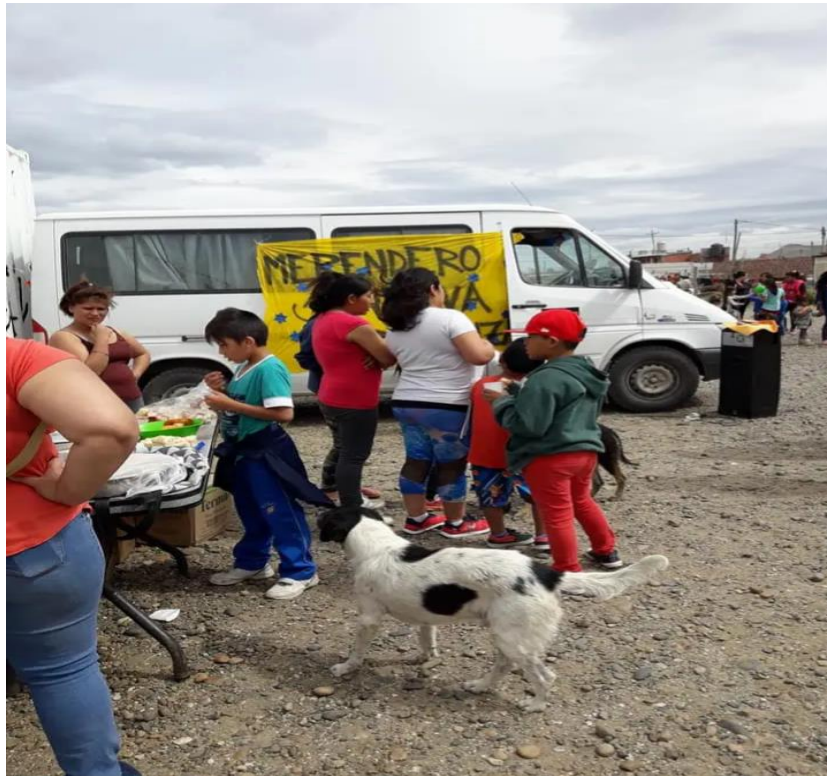
Imágenes en feria americana de B Comipa al aire libre. Con el objeto de recaudar fondos para sostener las viandas de las familias que concurren al Merendero.