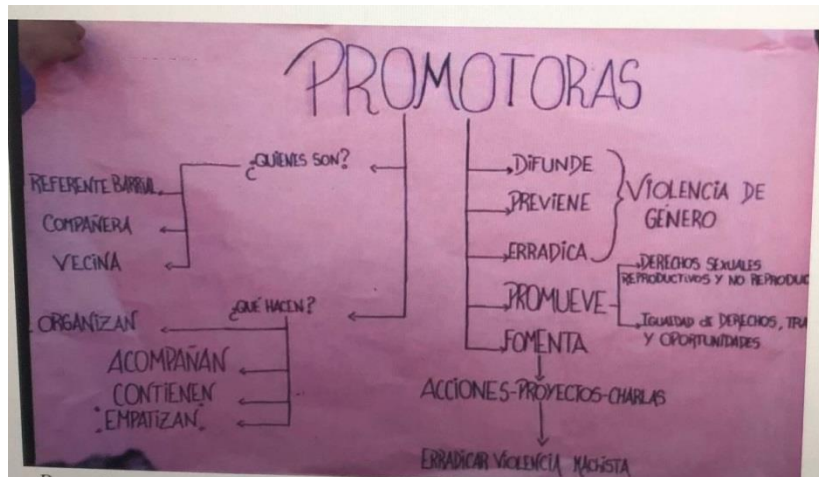
Definición de Promotoras de Género. Elaborado por ellas mismas en plenario mensual.