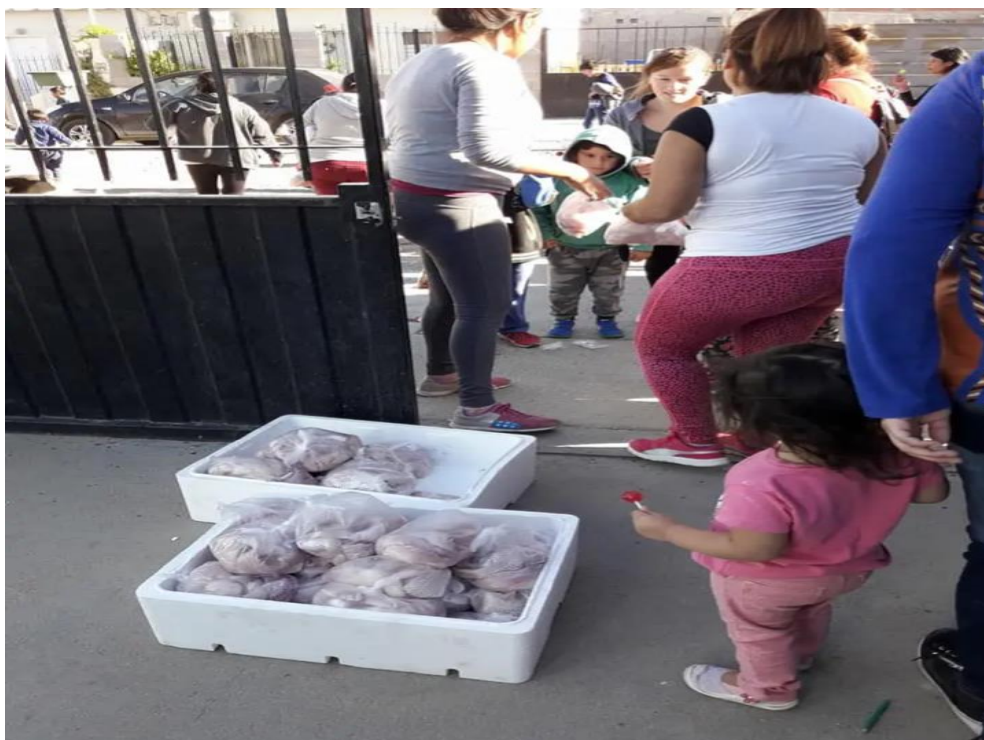
Entrega de la merienda a familias del Barrio estándar Norte de la ciudad de Comodoro Rivadavia.