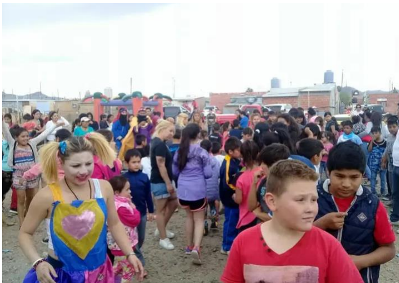
Imágenes obtenidas del festejo: día de reyes en B Comipa en conjunta con otras organizaciones de la comunidad del Barrio Don Bosco.