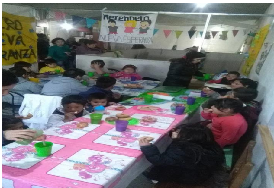
Niños y niñas compartiendo copa de leche en el Merendero Nueva Esperanza luego de compartir una tarde de juegos y lectura de cuentos.