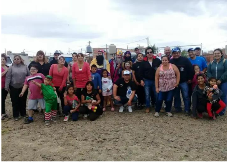
Imágenes obtenidas del festejo: día de reyes en B Comipa en conjunto con otras organizaciones de la comunidad del Barrio Don Bosco.